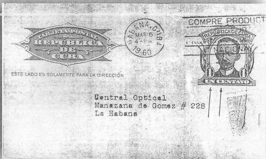
Ejemplar circulado por correos con error 1d

Todo lo expuesto hasta aquí no es más que una pequeña parte del material y de las posibilidades de estudio que existen con este entero postal cubano. Muchos y nuevos aportes podrían recibirse de otros colegas amantes de este tipo de coleccionismo, si así fuera éste sirva como punto de partida y el esfuerzo habrá sido recompensado